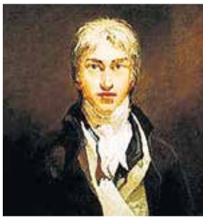
Joseph Mallord William Turner