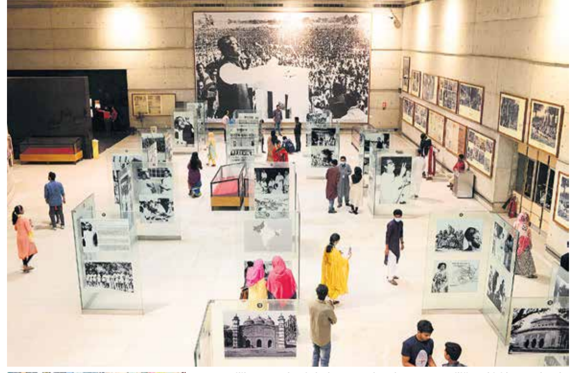
"Müzecilik ve Pandemi" buluşmasında salgının müzeciliğe etkisi konuşulacak.

Müzelerin sürdürülebilir olmasını sağlayacak kültürel